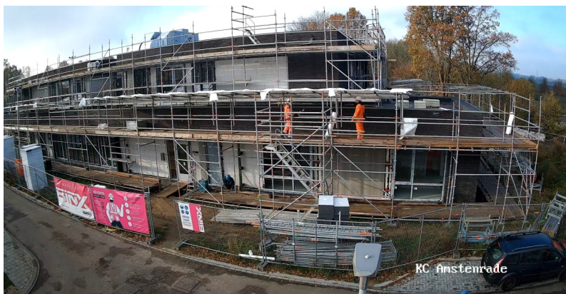
FOTO UPDATE NIEUWE SCHOOL