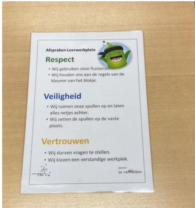
Poster afspraken op het leerwerkplein